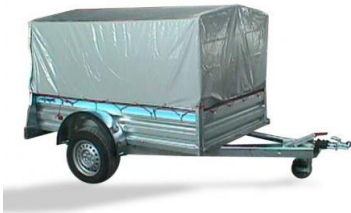
Arquillada con lona