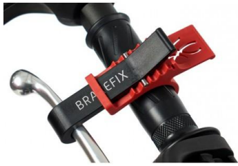
Sujeción de Freno