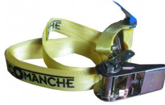
Cincha 25mm con Carraca