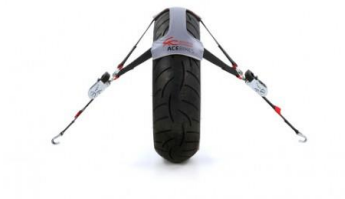
Sujeción de Rueda